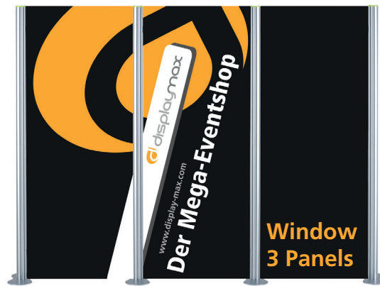
Window 3 Panels