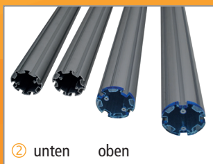
② unten oben

Bitte gehen Sie sorgfältig mit der Druckbahn um, vermeiden sie Knicke diese sind nicht mehr reparabel. Nur aufgerollt in der beigelegten Transporttasche lagern.