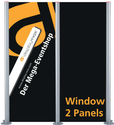
Window 2 Panels