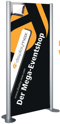
Messewand Window 1 Panel